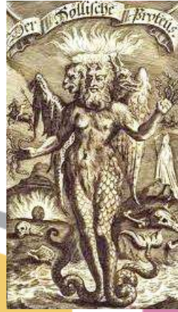
Deniz tanrısı Proteus

Benzer bir öykü de başka bir bakteri çeşidi olan proteus için anlatılmaktadır. Proteus bakterileri insan dışkı ve idrarında bulunurlar, yüksek sayıda olduklarında hastalığa neden olurlar. Bu bakterilerin tipik özelliği çok farklı şekillerde görülmüş olmalarıdır; ipliksi, düz, kıvrık, oval ve küre şeklinde görülebilirler. İşte farklı şekillerde karşımıza çıkan bu bakteriler klasik Grek mitolojisindeki " Proteus " ile aynı özelliği gösterirler. Deniz tanrısı Poseidon'un oğlu olan her şekle girme yeteneği olan bir tanrıdır Proteus.