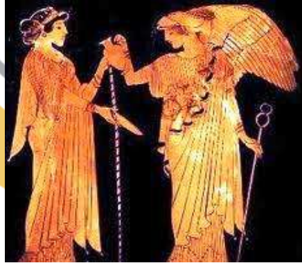
Tanrı Hera ve İris

Bir başka öyküye geçelim. Tanrıların yalanını ortaya çıkaran kanatlı bir melek olarak betimlenen İris , mitolojide gökkuşağının sembolüdür. Yağmurdan sonraya ortaya çıkan 7 rengin oluşturduğu, göğü yere bağlayan gökkuşağının yani "ebegümecinin" sembolüdür İris. Gözün rengini veren tabakaya, gökkuşağında oluşan renkler cümbüşü ile farklı renklerde oluşan göz renkleri ile kurulan benzerlikten dolayı iris tabakası adı verilmiştir.