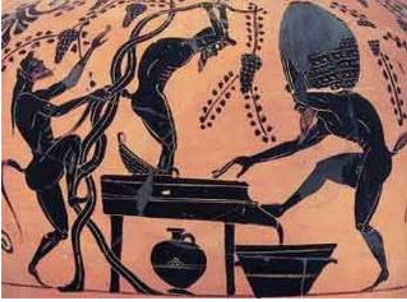
Kral'a üzüm suyu çıkarılması (Antik Yunan vazosu)