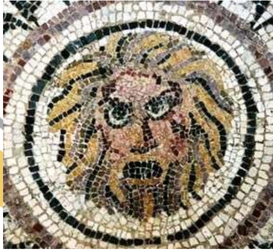
Phobos (Halikarnas’ta bulunan bu eser şimdi British Museum’da)

Son olarak insanların korkularını ifade eden psikiyatride genel amaçla kullanılan “ fobi ” den bahsedelim. Fobi kelimesi ilgili kelimenin sonuna eklenerek korkunun çeşidini ifade eder. Örneğin klostrofobi ; kapalı yer korkusu, zoofobi ; hayvan korkusu gibi. Ancak bu korkular normal korkulardan süresi, içeriği, mantık dışı olması ile ayrılır, tekrarlayan ve kişiyi normal yaşamda sıkıntıya sokan korkulardır. Fobilerde mantık yoktur ve kişi duyduğu korkunun gerçekçi olmadığını bilir. Keza sosyal fobi denilen şekilde kişide çeşitli durumlarda mahcup olma, hatta rezil olma korkusu vardır. Bu nedenle sosyal fobisi olanlar toplulukta konuşmaktan, çok iyi enstrüman çalmasına rağmen bunu topluluk önünde sergilemekten korkarlar. Mitolojide ise “ Phobos ”, savaş tanrısı Ares ’in yanından ayrılmayan ve korku ile dehşeti simgeleyen bir varlıktır. Aslında Ares ’in yardımcıları ikidir, biri “ Phobos ” öbürü ise “ Deimos ”tur. İlginç olan Ares ’in Roma mitolojisindeki karşılığı Mars ’tır. Yani kızıl gezegen de denen Mars . Peki neden kızıl ? Savaş demek kan demek, yani kızıl renk demektir Ares , Mars ise savaş tanrısıdır ve dünyamızdan bakıldığında kızıl renkli görülüyor. Ve son bir bilgi. Mars ’ın iki uydusu vardır, birinin adı Phobos , diğeri ise Deimos ’tur. İlginç değil mi ?