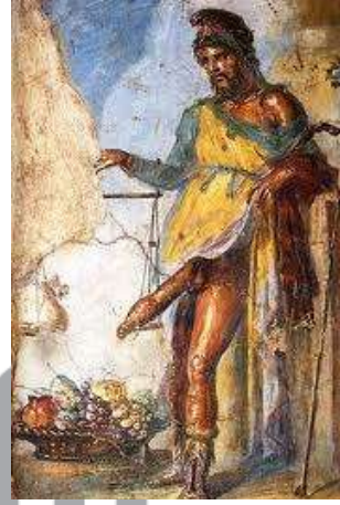
bereket tanrısı Priapos

Bir başka tıp ile mitoloji buluşması vücut ateşinde görülür. " Febris " Grek mitolojisinde "ateş ve sıtma tanrıçası"dır. Tıpta da febris deyimi yüksek ateşli hastalıklarda kullanılan bir terimdir. Örneğin çocuk yaş grubunda görülen yüksek ateşe bağlı konvülsiyonlar, yani "havale geçirmek", tıp literatüründe " febril konvülsiyon ", keza ateşin erken bir bulgu olarak görüldüğü bir çeşit kan hastalığına da " febril nötropeni " denilmektedir.